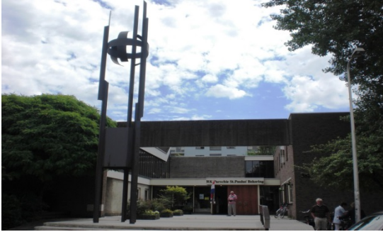
St Paulusbekingkerk, Merellaan 352 Capelle a/d IJssel.

Abraham van Rijckevorselweg RA, over een brug, met de bocht mee naar LI, RE, LI, voorbij de afvalbakken en voor het IJsselcollege RA de Merellaan in, daar vindt u de