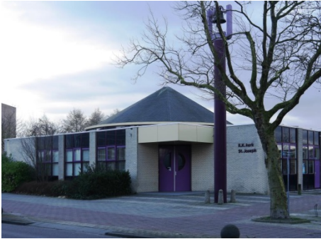
St Josephkerk, Kerklaan 20 Nieuwerkerk a/d IJssel.

een ruimtelijk inrichtingsplan opgesteld. Op basis van een lijn tussen de kerken van Moerkapelle en Moordrecht werd een raster ontworpen met daarin "blokken" van ongeveer 800 × 800 meter. De sloten eromheen worden "tochten" genoemd. In 1825 werd begonnen met de daadwerkelijke drooglegging van het gebied. Met behulp van dertig windmolens werd de polder leeg gemalen naar een ringvaart en in 1840 was de klus geklaard. Veertig jaar later namen stoomgemalen (voor het eerst gebruikt in de Zuidplaspolder) de taak van de molens over om de waterstand te regelen. Tegenwoordig staan er elektrische gemalen. Op enkele plaatsen na is het oorspronkelijke raster bewaard gebleven. In deze polder bevindt zich het laagste punt van Nederland. Rechts vindt u de