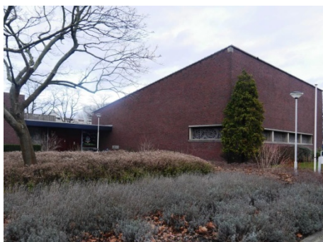
Start: St. Caeciliakerk, Zocherstraat 90, Rotterdam

Afkortingen: RA. = rechtsaf RE = rechts LA. = linksaf LI = links RD = rechtdoor TSP = t. splitsing KNP = knooppunt